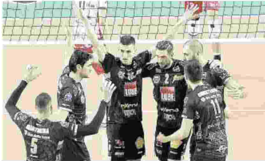
La Lube Civitanova festeggia dopo un punto

Domenica la capolista Cucine Lube è attesa dalla bolgia del Pala Evangelisti di Perugia per il match tra la prima e la seconda forza del campionato. Perugia, già in final four di Coppa dei campioni in quanto società organizzatrice dell'evento che si