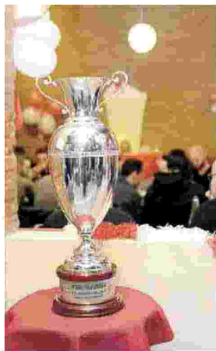
Le immagini della bella festa della Lube andata in scena al disco pub Tartaruga

la che ancora dobbiamo giocare - ha aggiunto entusiasta - era da tempo che non vincevamo una finale, ma adesso arriva la sfida. L'obiettivo è quello di giocarcela con tutti fino all'ultimo, dalla Champions al campionato». E poi ha concluso: «Adesso ci guardano in maniera diversa, si aspettano di più. Il traguardo è puntare in alto». Tra un selfie e un brindisi, alzando l'ambita Coppa dopo cena, i campioni si sono intrattenuti con i fan. Da veri professionisti non hanno fatto le ore piccole, pensando già alla prossima gara di campionato: la sfida di domenica a Perugia.