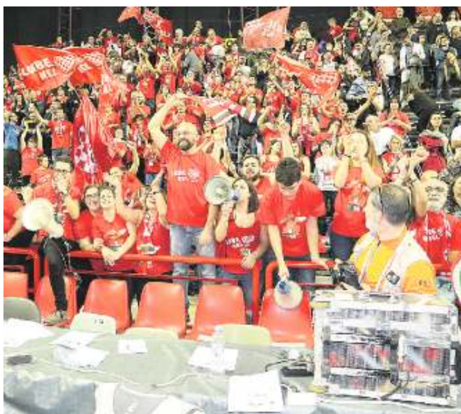
I tifosi della Lube domenica scorsa in trasferta a Perugia. Anche stasera a Civitanova la loro carica sarà determinante

La prima di due partite in cinque giorni per blindare il primo posto in campionato