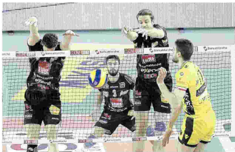
Un muro della Lube, forse poco ortodosso ma sicuramente andato a buon fine