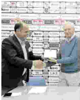
La consegna della targa

CIVITANOVA Un matrimonio destinato a durare. Non è solo quello della Lube con Civitanova ma anche quello della società di volley con la Palace srl che gestisce l'Eurosuole Forum. Un incarico portato avanti proprio in collaborazione con la Lube. Si devono infatti al club la pulizia e la manutenzione ordinaria della struttura, come il rimborso del pagamento delle utenze.